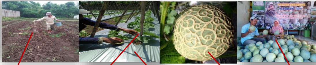
gambar 1.1 proses pemupukan dan inovasi penanaman buah bermotif