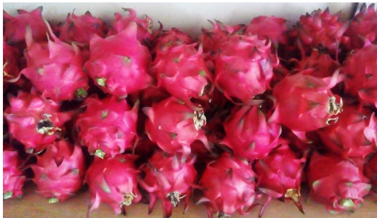
Gambar 1. Buah Naga Red

Desa Sidodadi adalah sebuah desa yang terletak di Kecamatan Paiton Kabupaten Probolinggo Propinsi Jawa Timur. Salah satu desa penghasil buah naga super Red terbesar di kecamatan Paiton, potensi buah naga super red ini sangat bagus sehingga setiap kali panen dalam satu pohon rata-rata menghasilkan 20 Kg, sedangkan jumlah pohon naga super Red yang terdapat di desa sidodadi berjumlah 250 pohon dan menghasilkan produksi sebesar 50-100 ton. Produksi buah naga kualitas baik jenis super Red sekali panen sekitar 10% (50-100 ton) untuk 250 pohon di desa sidodadi. Gambar buah naga Red diperlihatkan pada gambar 1. Sedangkan gambar 2 menunjukkan kebun buah naga super red .