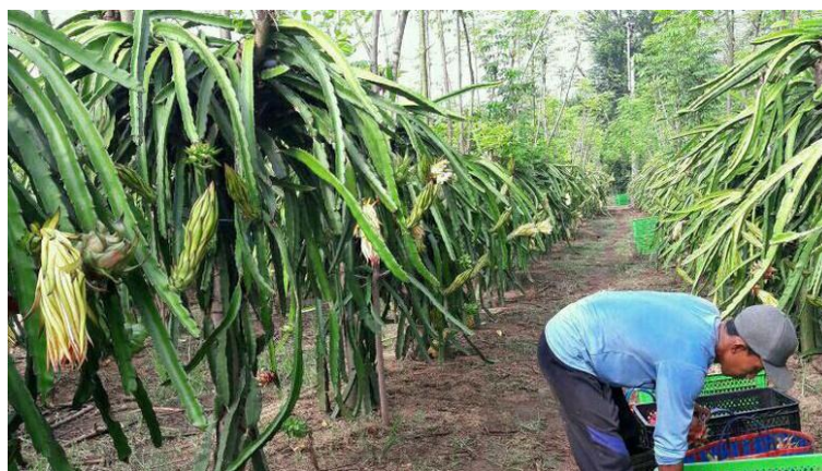
Gambar 2. Kebun Buah Naga Super Red Di Desa Sidodadi

Buah naga atau dragon fruit atau buah pitaya berbentuk bulat lonjong seperti nanas yang memiliki sirip warna kulitnya merah jambu dihiasi sulur atau sisik seperti naga. Buah