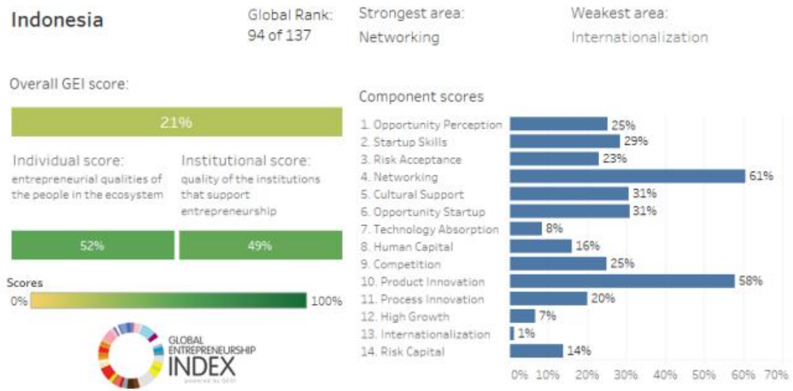
Gambar 1.1 Statistik Kewirausahaan Indonesia 2018

Pada saat ini penanaman yang efektif dengan menumbuhkan kewirausahaan, karena Kewirausahaan telah diadopsi di seluruh dunia, sebagai strategi untuk memfasilitasi partisipasi ekonomi di antara anak muda [3]. Statistik pada Indonesia mempunyai kekuatan pada networking [4],